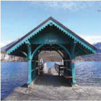
@ Guilhem Vellut

Divers modes de circulation s'offrent à vous pour circuler de Saint-Jorioz vers Annecy ou vers les autres communes alentours. Que ce soit en voiture, à pied, en vélo, en bus ou en bateau tous les chemins mènent à Saint-Jorioz !